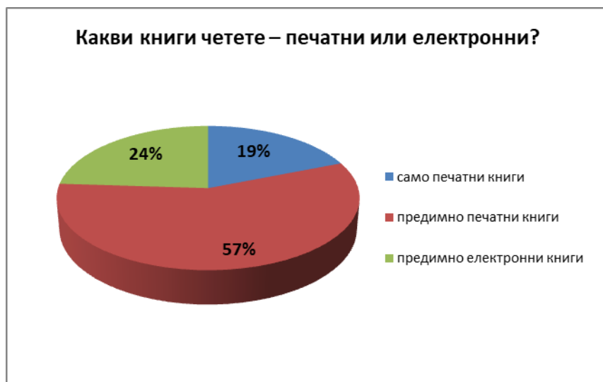
Таблица 3: Предпочитания към един от двата книжни формата

Въпреки изявеното пристрастие към печатния формат, нито един от анкетираните не смята, че интересът към него се увеличава. Мнозинството (76%) са на мнение, че интересът към печатните книги в общи линии се запазва. Тези, които смятат, че интересът намалява (24%), определят намалението като „умерено“ или „слабо“, но никой не споделя опцията „драстично“. Причините за спада на интереса към печатните книги се търси най-вече в масовото навлизане на новите информационни технологии, особено популярни сред младите хора. Един от респондентите вижда причината в „огромното разнообразие от занимания за запълване на свободното време, за набиране на информация, учене“, достъпно чрез електронните устройства.