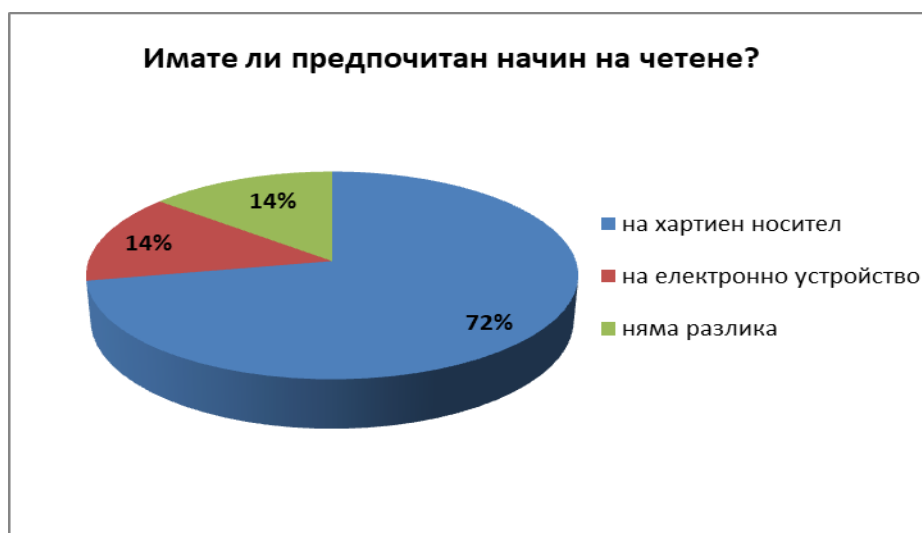
Таблица 1: Предпочитания относно начина на четене

Сред предимствата, най-много интервюирани споделят по-лесното възприемане (48%), а 14% – по-лесното запаметяване. Половината от интервюираните са се възползвали от възможността да споделят други причини за предпочитанието си да четат на хартиен носител, като изтъкват най-вече сетивните възприятия и физическия контакт с книжното тяло. Ето някои от изразите, с които е формулиран този вид предпочитание към хартиеното книжно тяло: „удоволствие от допира“, „докосване на книгата“, „обичам миризмата на книгите“, „включване на повече сетива в процеса“. Пристрастието към хартиения носител има и естетическа страна, изразена чрез „разглеждам я като произведение на изкуството“, „доставя ми удоволствие, когато корицата, хартията, оформлението са добри“. Срещат се и чисто прагматични основания като „възможност за водене на записки“ и „удобство на книжния носител“. Някои от предпочитанията се основават на сравнение с недостатъци на електронното устройство като „по-малко зрително натоварване“ и „не се притеснявам, че ще падне батерията“. Използвана е и по-общата формулировка „по-пълноценно изживяване“.